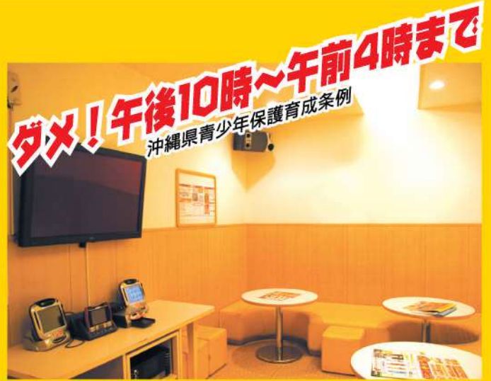
カラオケボックス