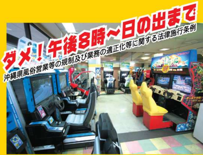
ゲームセンター ※一部は午後10時~午前4時まで

※興行場等とは、映画館、演劇場、ボウリング場、ビリヤード場、スケート場、ゲームセンター、カラオケボックス、インターネットカフェ、マンガ喫茶などをいいます。