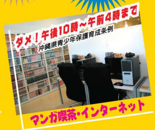
マンガ喫茶・インターネット

そのほか、深夜営業のコンビニ、飲食店を含め、全ての県民には青少年の深夜のはいかいを防止する努力義務があります。