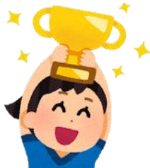
新聞記事(琉球新報) R1. 5. 23

最高賞に長嶺中 真嘉比小決まる 小中広報誌コンクール 第30回県小中学校PTA PTA連合会II石川謙会 長の最終審査が22日、 那覇市開の同連合会館で開 かれた。最優秀賞は小学校 の部が那覇市立長嶺中 校の「若き鷹」に決まった。 II写真。最優秀2紙を含む 中学4紙、小学6紙が全国 コンクールに出品される。紙の盛衰があった。 PTA活動の報じ方、地 域・社会との連携、写真の 使い方、読みやすさなどが 審査された。「若き鷹」は、8回以上 の発行回数やタイムリーな 防災特集などが、一まかん ちの「は深みのある地域行 事特集、バランスの良いレ イアウトなどが評価され た。小学校2紙、中学校3紙 江、北中城