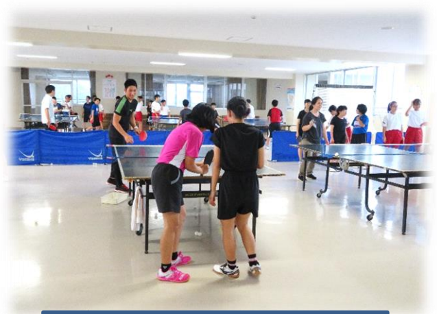
部活動巡り・卓球部 (R1. 5. 14)

「地区大会に向けて、部活動を通して教師と生徒の交流を深めるとともに、選手を激励することで感謝の気持ちを育み、大会への意欲を高める。」の目的で毎年恒例である部活動巡り実施しています。校内にある全ての部活動(男女バスケット、男女バレーボール、男女ハンドボール、男女バドミントン、男女卓球、剣道、野球、サッカー、ソフトテニス、工学部、吹奏楽部、美術部)の部員に、先生方が挑みました。校務多用の中でしたが多くの教職員が参加しました。日ごろの運動不足や老体にむち打って善戦しました。夏季大会は、それぞれの目標を達成するよう、チーム一丸となって取り組みましょう。祈・優勝!